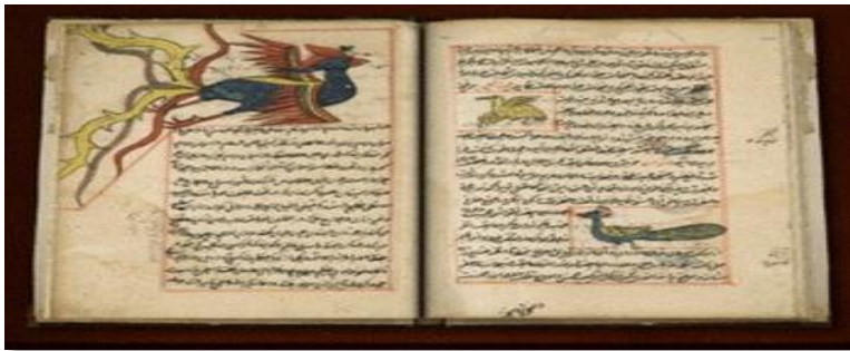
شكل (2) صورة للعنقاء من كتاب عجائب المخلوقات و غرائب الموجودات للقرويني 1203م

أ- العنقاء عند العرب: تناول العرب الأساطير في الشعر والأدب والروايات وذكرت العنقاء في كتاب ألف ليلة وليلة ومن أبرز صفاته أن جسده مغطى بريش جميل ملون بالأحمر والذهبي وله ذيل طويل، شكل (2).