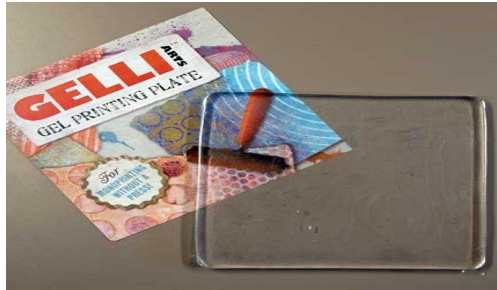
شكل (8) قالب الجلي بليت الطباعي

تضم الطباعة المستوية عدد من التقنيات: lithography, monotype, وتضم تقنية lithography عدد من التقنيات: Paper, Offset printing, Waterlees printing, Stone lithography, lithography, gelli plate printing. وسنقوم في التجريب بتناول تقنية gelli plate printing. شكل (8) وهي تشابه في طريقتها تقنية monotype.